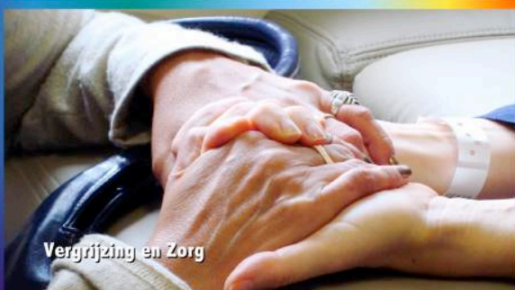
Vergrijzing en Zorg